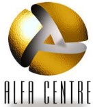
Tableau de bord Etoile Avril 2011